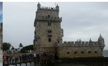
Torre de Belém

Lembramos que a tarifa da parte aérea pode sofrer modificações. O preço da parte terrestre permanece o mesmo, com exceção da noite extra e do traslado de saída em Barcelona, que podem variar de acordo com os câmbios do euro e dólar do dia.