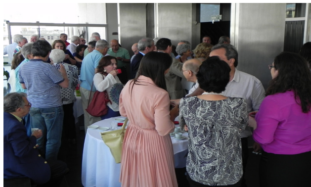
Interação: participantes confraternizam ao final da palestra

“Fiquei 55 anos na Usiminas e fico muito feliz de falar bem dela e gostaria que todos assim o fizessem. Maior transparência só traz benefícios – nos informamos com mais propriedade e o diálogo só melhora, com todos expressando sua opinião, dando sugestões”, exortou ela.