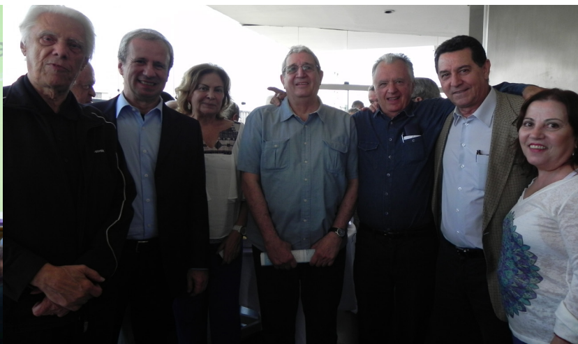
AAPPU: recebendo representantes da Previdência Usiminas, associados e Usiminas

EVENTOS: CONFRATERNIZAÇÃO DE NATAL - PÁG. 7 EXCURSÕES – PÁG. 8