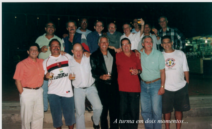
A turma em dois momentos...