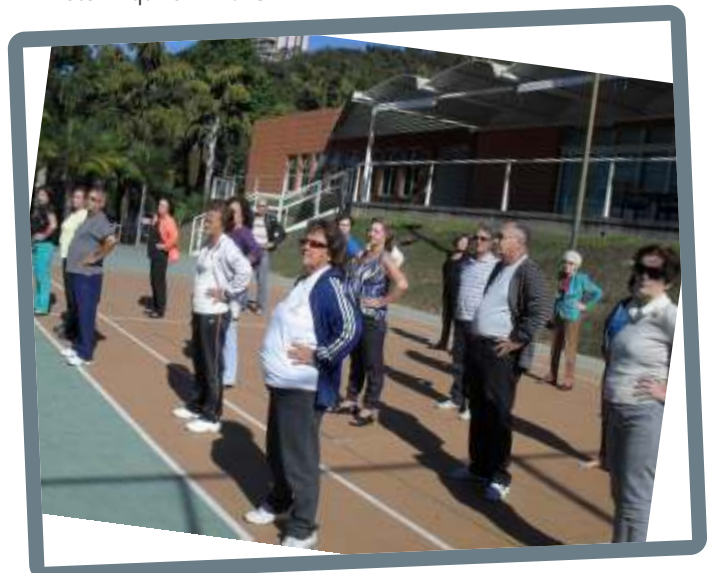
Exercícios, sol na cabeça e o espaço convidativo da AEU