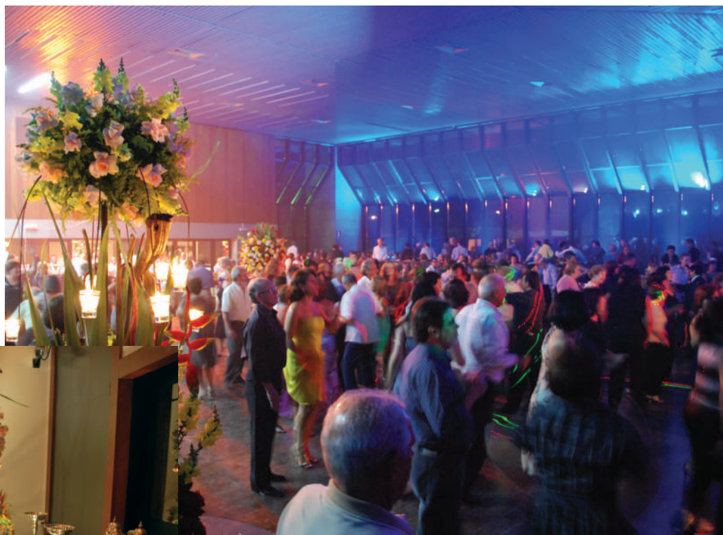
Salão do Minas Tênis, tomado pelos Associados