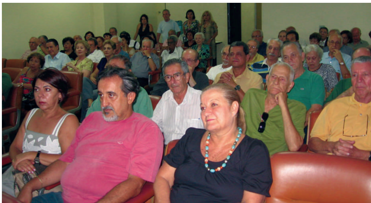
Auditório cheio com a presença dos Associados

O número de associados presentes superou as expectativas até dos mais otimistas. Pelo histórico da Associação, nunca uma Assembléia foi tão participativa. Isto demonstra o apoio recebido pela diretoria eleita dando-lhe um respaldo extraordinário, mas também aumenta – se é que é possível - a sua responsabilidade referente ao atendimento aos anseios dos amigos que construíram e mantêm esta grande família em que se transformou a Associação dos Aposentados e Pensionistas da Caixa dos Empregados da Usiminas.